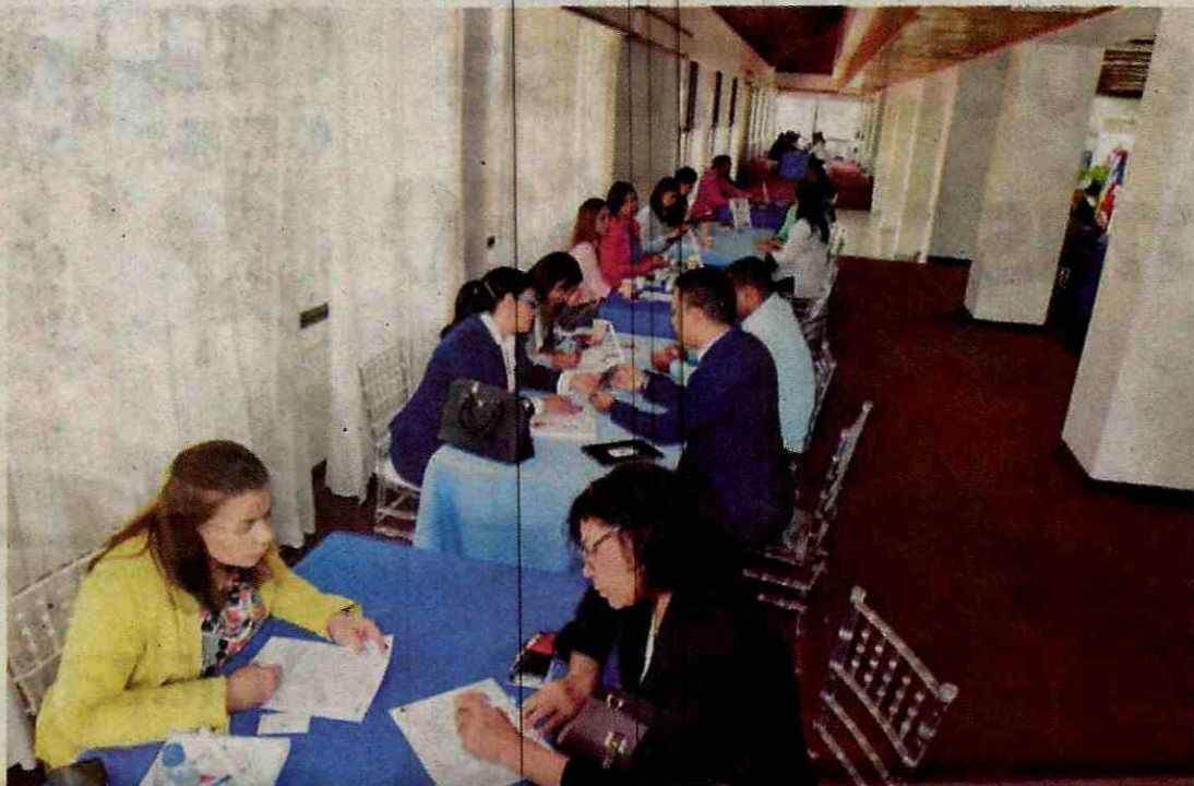
Rueda de negocios del sector público y empresarios del sector mipymes.

Durante el evento se realizaron capacitaciones en el uso del Portal Transaccional y en las distintas herramientas de acceso al Sistema de Compras Públicas, sobre inscripción en línea y actualización del registro de proveedores y la cuenta de beneficiario de pago, presentación de ofertas en línea, acceso a más oportunidades de negocio con el Estado, entre otros, con el propósito de continuar eliminando barreras de acceso