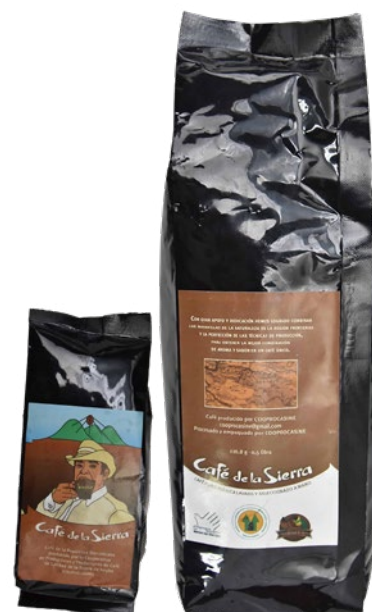
Café de la Sierra