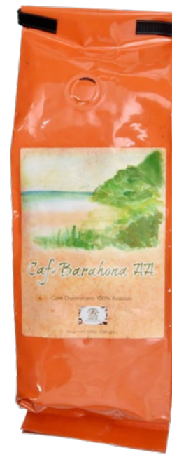
Café Barahona HH

Productor: Dominican Coffee Company, S. R. L. Ubicación: Barahona Tel.: 809.623.0056