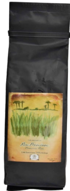
Café Ron Premium

Productor: Dominican Coffee Company, S. R. L. Ubicación: Barahona Tel.: 809.623.0056