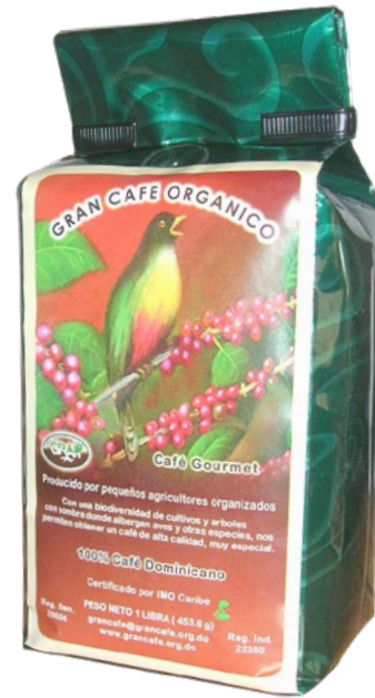
Gran Café Orgánico