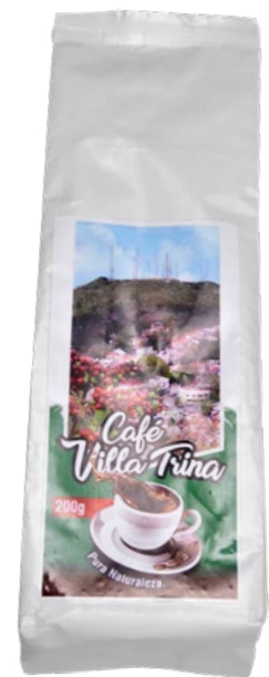
Café Villa Trina