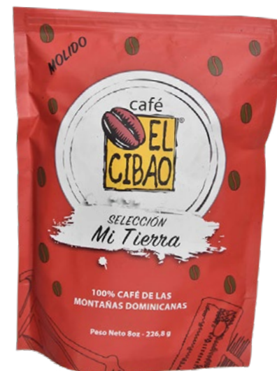
Café El Cibao