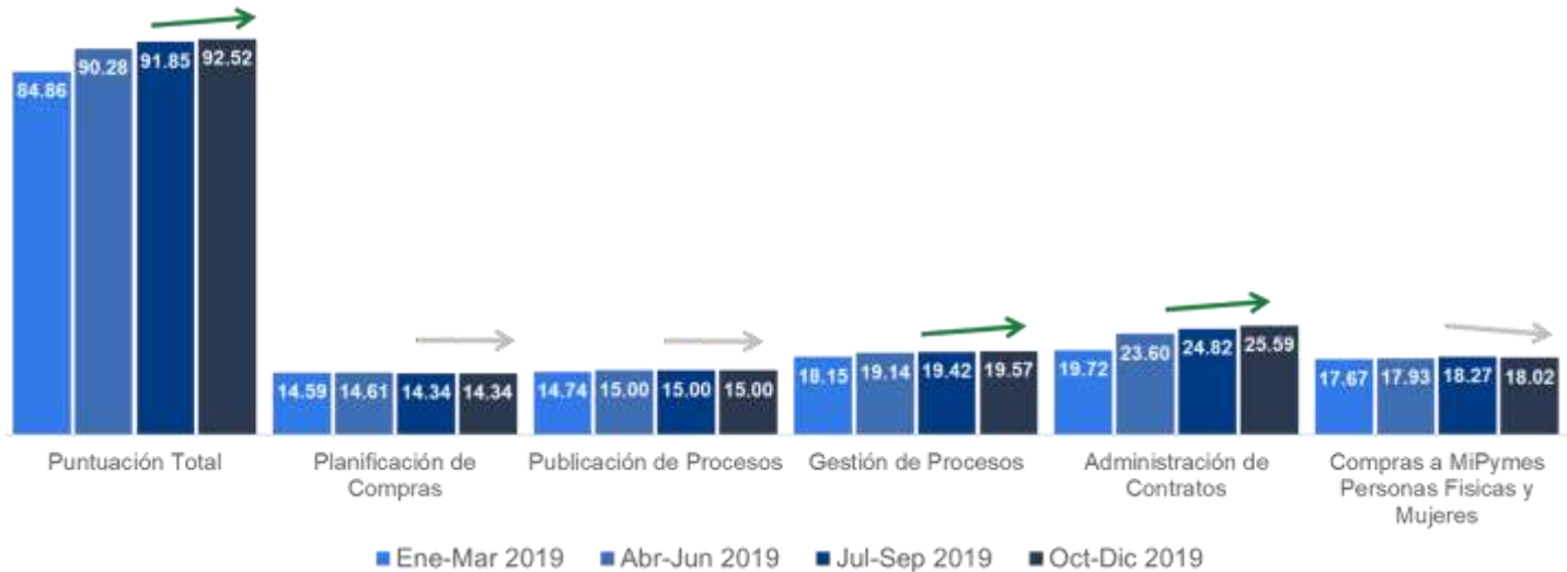
Comportamiento de SISCOMPRAS enero – diciembre 2019.

El SISCOMPRAS viene monitoreándose desde el primer trimestre del 2018. En el siguiente gráfico se puede ver el comportamiento del sistema en las diferentes mediciones durante el periodo Enero – diciembre 2019.