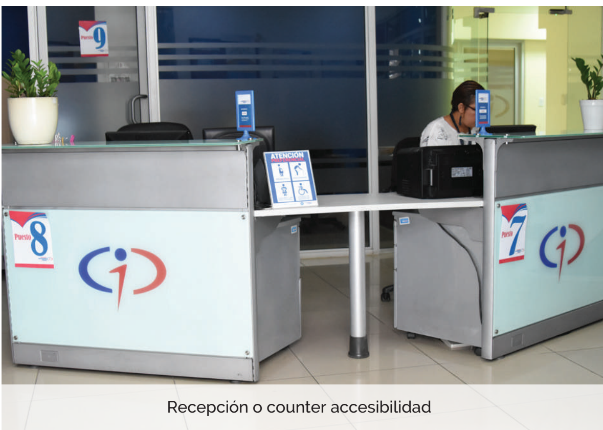
Recepción o counter accesibilidad