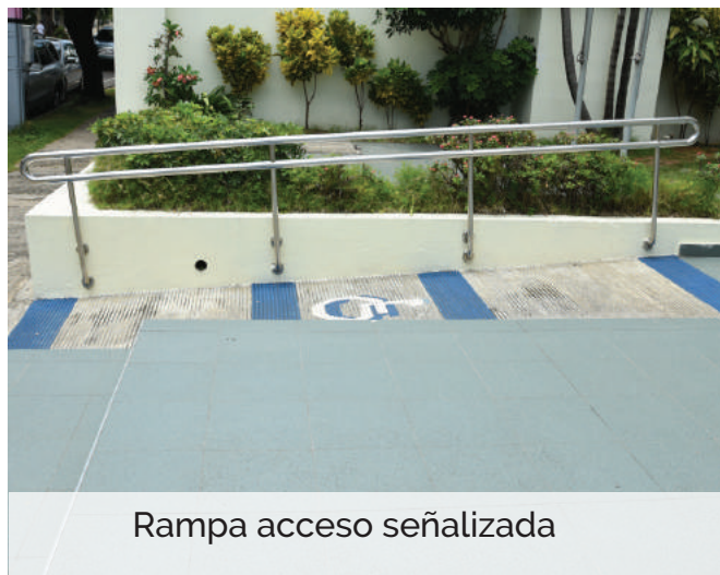
Rampa acceso señalizada