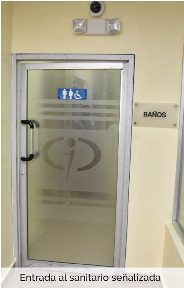
Entrada al sanitario señalizada