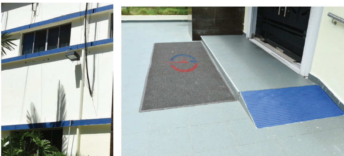
Rampa acceso instalación señalizado