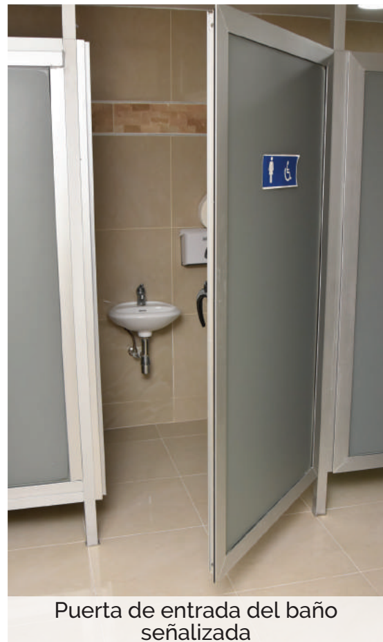
Puerta de entrada del baño señalizada