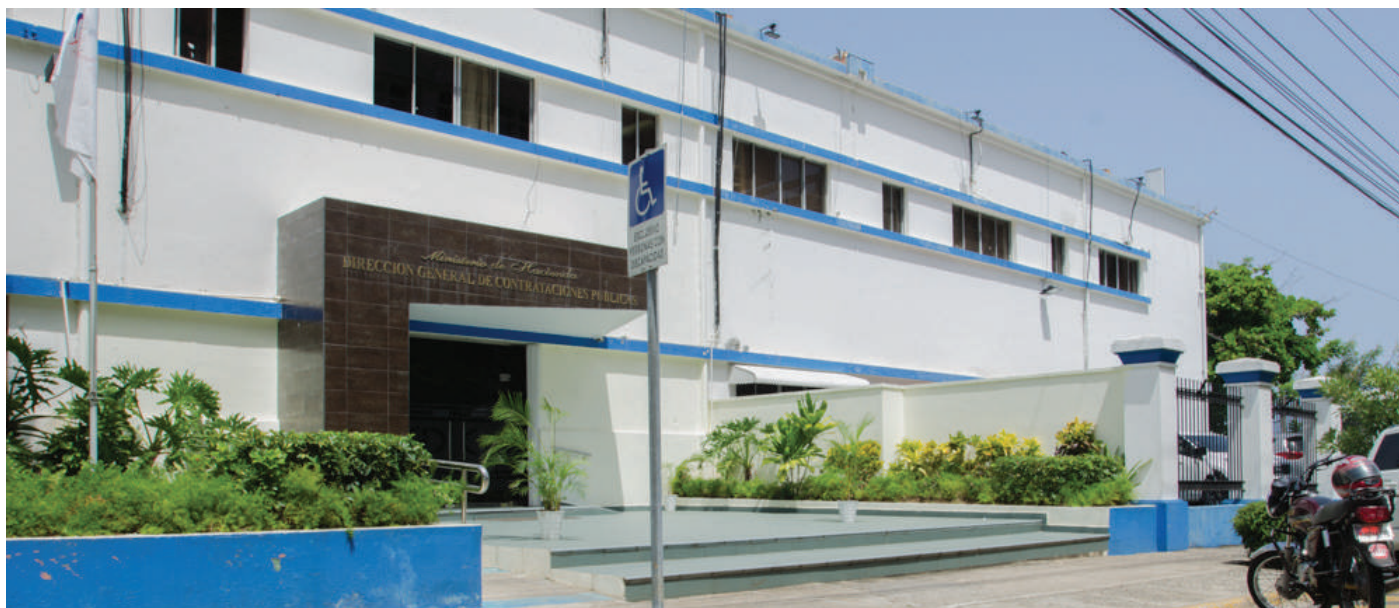
Parqueo y rampa acceso señalizados

A CONTINUACIÓN, SE PRESENTA EJEMPLOS DE NIVELES DE ACCESIBILIDAD EN LAS INSTALACIONES DE CONTRATACIONES PÚBLICAS.