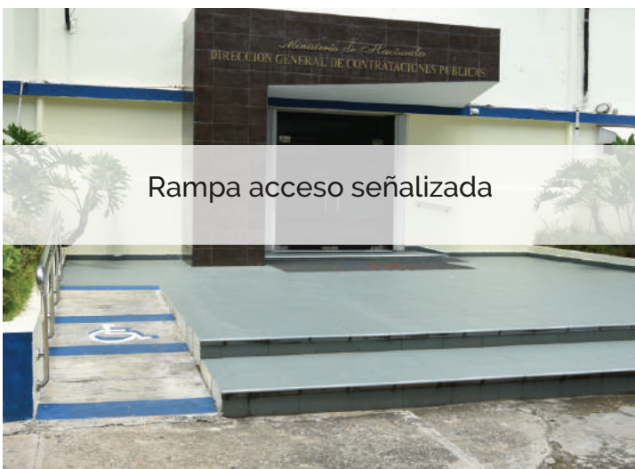
Rampa acceso señalizada