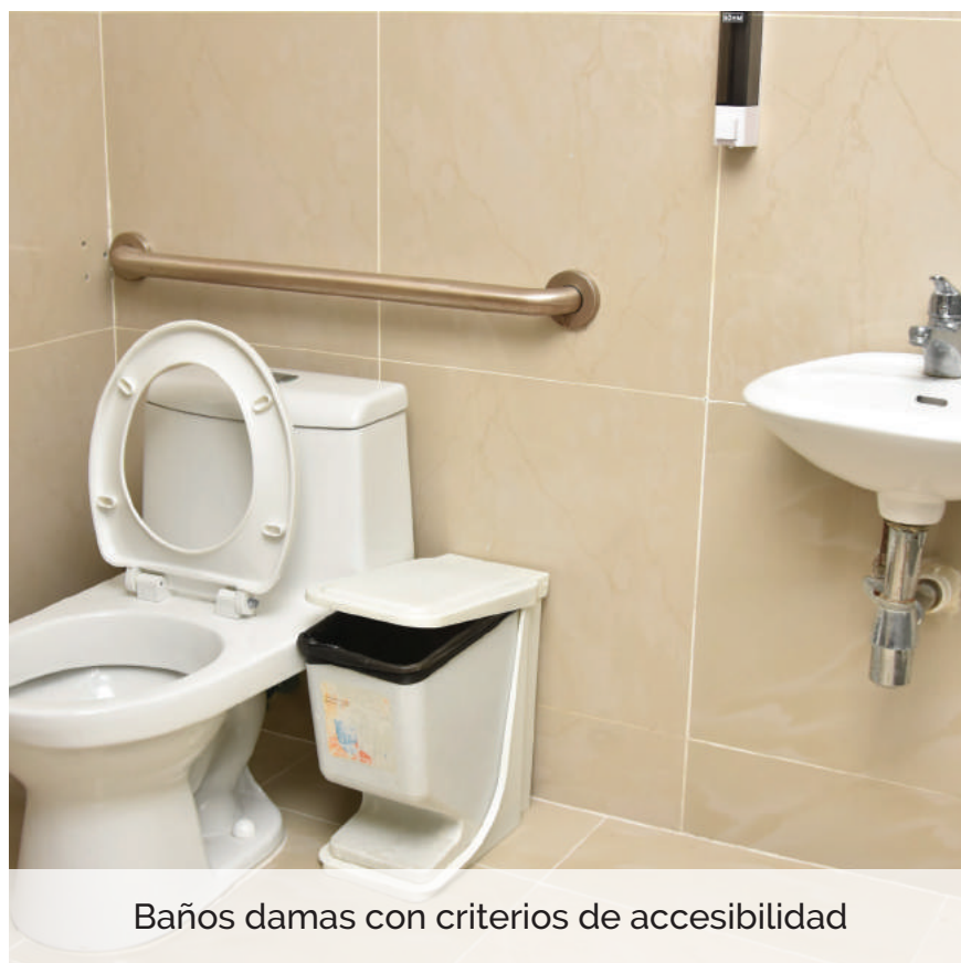
Baños damas con criterios de accesibilidad